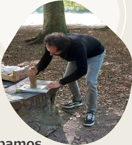
Estampamos hojas en telas