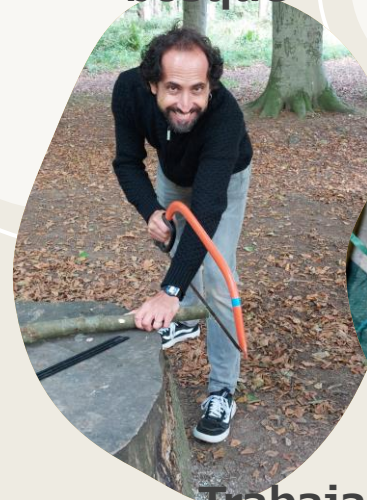
Trabajamos la madera usando herramientas de forma segura