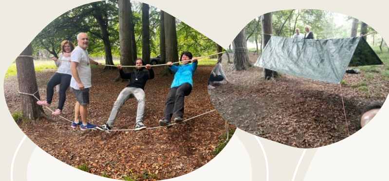
Usamos los mejores nudos para construir puentes