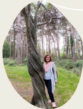
Observamos un árbol con los ojos cerrados y lo reconocimos entre todos los demás.