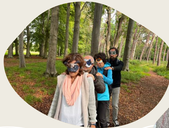
Confiamos los unos en los otros, y nos guiamos por los sonidos del bosque