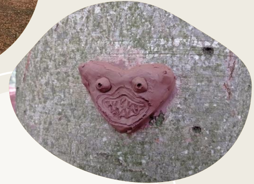
Moldeamos el barro y decoramos nuestro árbol